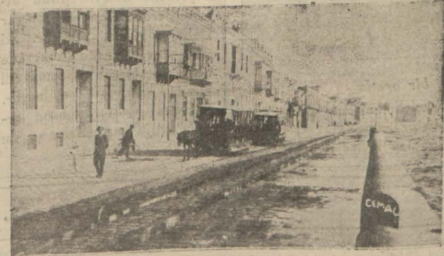
İzmir rıhtımı ve şirkete ait tramvaylar

İmtiyaznamenin Hükûmetçe Feshedilmesi İhtimalleri Şayidir